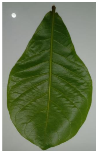
Gambar 1. Daun ketapang ( Terminalia catappa )

Proses ekstraksi limbah daun ketapang pada penelitian ini dilakukan dengan menggunakan metode maserasi. Metode ini digunakan karena pengerjaannya sederhana dan sesuai dengan komponen yang mudah menguap. Dari hasil maserasi sampel didapatkan ekstrak kental aquades daun ketapang yang dilanjutkan dengan pengujian fitokimia secara kualitatif.