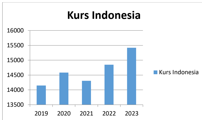
Gambar 3. Kurs Indonesia

dolar AS, menunjukkan bahwa Indonesia semakin bergantung pada ekspor sebagai sumber pendapatan utama dalam perdagangan internasional. Namun demikian, pada tahun 2023, terjadi penurunan tajam di mana net ekspor turun menjadi 36,930 miliar dolar AS, mengindikasikan kemungkinan adanya perubahan dalam permintaan global atau tantangan dalam struktur ekonomi domestik yang mempengaruhi kinerja ekspor Indonesia.