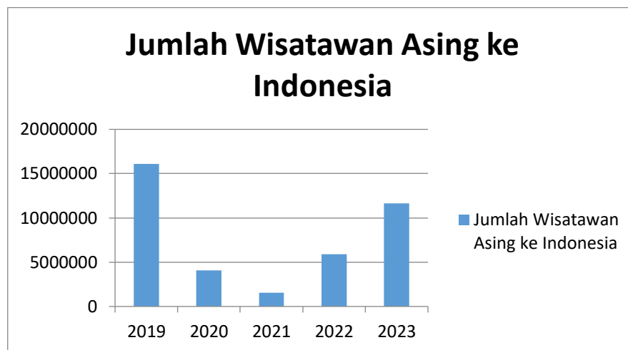
Gambar 5. Jumlah Wisatawan Asing ke Indonesia

Pada tahun 2022, FDI terus meningkat, hampir kembali ke level tahun 2019 dengan total 24,702,029,705 USD. Lonjakan paling signifikan terjadi pada tahun 2023, dengan FDI mencapai 47,340,000,000 USD, hampir dua kali lipat dari tahun sebelumnya. Peningkatan dramatis ini bisa jadi disebabkan oleh berbagai faktor, termasuk perbaikan kondisi ekonomi global, kebijakan pemerintah yang lebih ramah terhadap investasi asing, dan peningkatan kepercayaan investor terhadap prospek ekonomi Indonesia. Data ini menunjukkan bahwa meskipun ada tantangan besar di tengah pandemi, Indonesia berhasil menarik kembali dan bahkan meningkatkan investasi asing langsung dalam jangka waktu lima tahun terakhir.