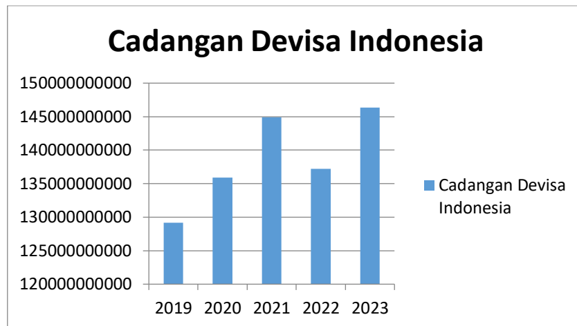
Gambar 1. Cadangan Devisa Indonesia

Berdasarkan gambar 1, pada tahun 2019, cadangan devisa Indonesia mencapai 129.183 miliar dolar AS. Selama lima tahun berikutnya, cadangan devisa ini mengalami fluktuasi yang signifikan. Pada tahun 2020, cadangan devisa meningkat menjadi 135.897 miliar dolar AS, mencerminkan stabilitas ekonomi meskipun dalam konteks pandemi COVID-19 yang mempengaruhi ekonomi global. Tren positif ini berlanjut pada tahun 2021, di mana cadangan devisa mencatatkan kenaikan menjadi 144.905 miliar dolar AS, menunjukkan pemulihan ekonomi yang kuat setelah masa krisis. Namun demikian, pada tahun 2022, cadangan devisa mengalami penurunan menjadi 137.233 miliar dolar AS, mungkin dipengaruhi oleh faktor-faktor seperti fluktuasi nilai tukar dan kebijakan moneter yang berubah. Tahun 2023 kembali menunjukkan peningkatan dengan mencatatkan cadangan devisa sebesar 146.383 miliar dolar AS, mengindikasikan upaya pemulihan dan kebijakan yang efektif dalam mengelola cadangan devisa untuk mendukung stabilitas ekonomi jangka panjang Indonesia.