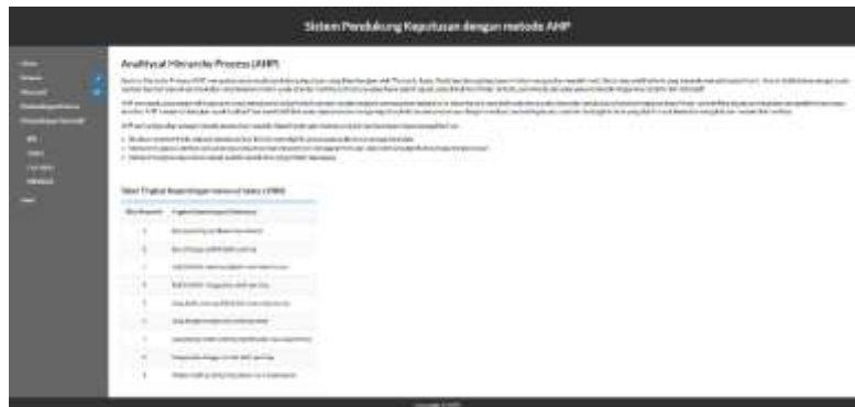
Gambar 2. Tampilan Home SPK AHP

Pada penggunaan metode AHP dalam penelitian ini mengembangkan Sistem Pendukung Keputusan (SPK) berbasis web menggunakan bahasa PHP dan MySQL. SPK akan digunakan oleh fakultas untuk memasukan data kriteria dan alternatif mahasiswa dan dilakukan perhitungan menggunakan metode AHP. Tampilan berikut menunjukan hasil sistem yang telah dikembangkan.