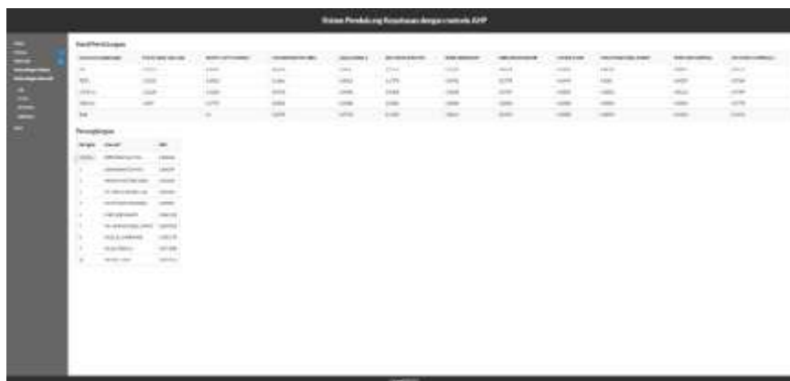
Gambar 7. Tampilan Hasil Perangkingan Pada Web

Gambar 6. Tampilan Hasil Perbandingan Kriteria Pada Web menampilkan hasil dari perbandingan antar kriteria satu dengan lainnya. Maka menghasilkan nilai dibawah dari 10%.