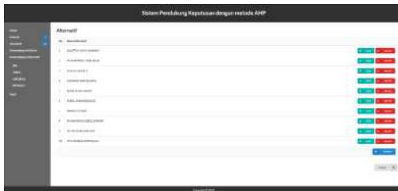
Gambar 4. Tampilan Alternatif Pada Web

Gambar 3. Tampilan Kriteria Pada Web menampilkan kriteria yang digunakan dan jumlah kriteria yang telah ditetapkan. Terdapat juga action edit dan delete, edit mengubah data kriteria dan delete guna menghapus kriteria.