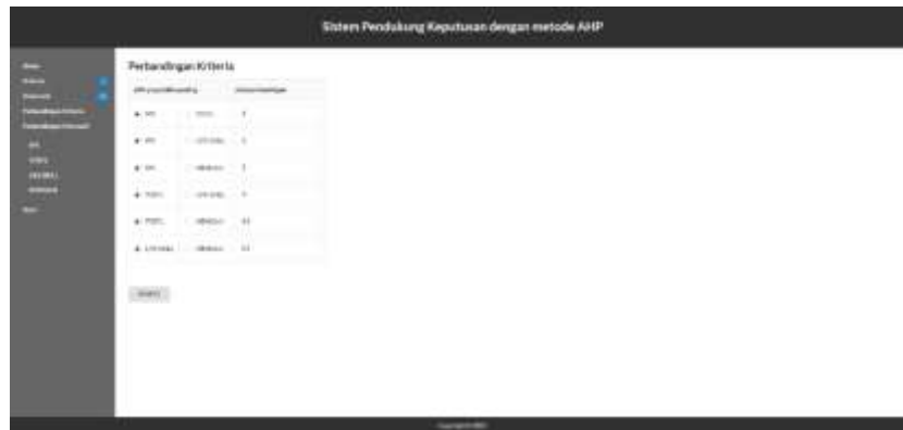
Gambar 5. Tampilan Perbandingan Kriteria Pada Web

Gambar 4. Tampilan Alternatif Pada Web Menampilkan alternatif yang digunakan sebagai perhitungan antar alternatif nantinya.