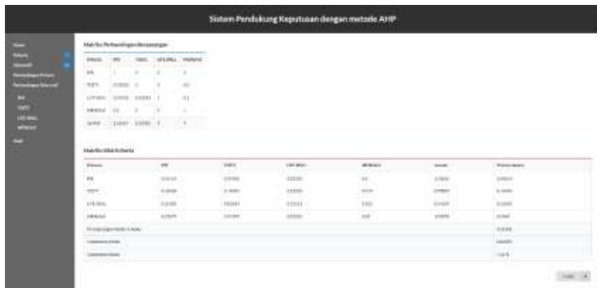
Gambar 6. Tampilan Hasil Perbandingan Kriteria Pada Web

Gambar 5. Tampilan Perbandingan Kriteria Pada Web Kriteria mana yang lebih penting dan nilai perbandingannya sesuai dengan perhitungan sebelumnya. Dan pilih lingkaran pada kriteria mana yang lebih penting kalau sudah tinggal di submit.