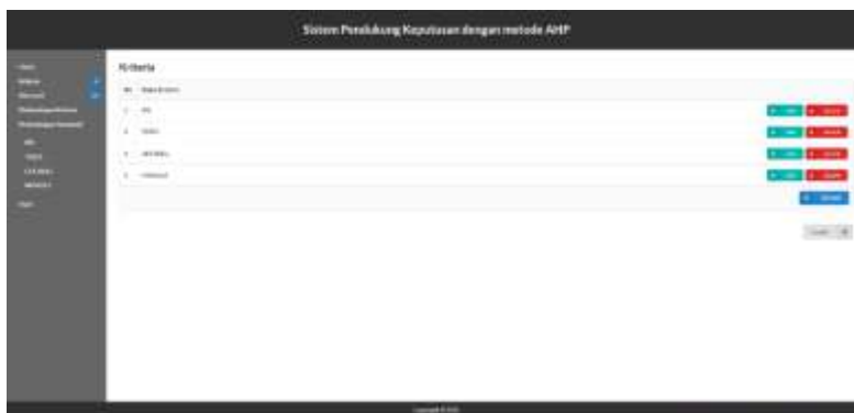
Gambar 3. Tampilan Kriteria Pada Web

Gambar 2. Tampilan Home SPK AHP menampilkan halaman ini menampilkan pengertian Analytical Hierarchy Process (AHP), fungsi metode AHP dan tabel tingkat kepentingan.