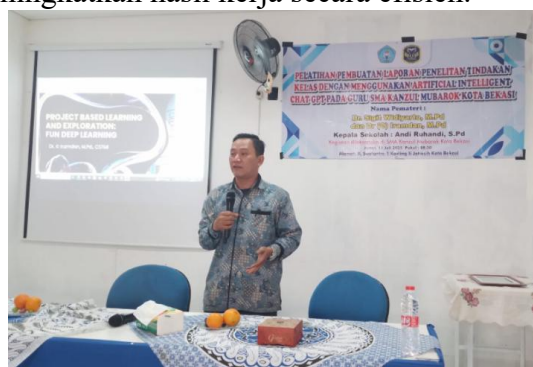
Gambar 2. Ketua Kegiatan

Pembahasan lebih jauh menegaskan bahwa keberhasilan kegiatan ini tak lepas dari pentingnya sosialisasi dan pelatihan terhadap teknologi berbasis AI. Pemahaman terhadap teknologi baru sangat diperlukan agar para guru dapat memanfaatkan peluang transformasi digital secara optimal. Seperti yang dikemukakan bahwa perkembangan teknologi memunculkan inovasi baru, tetapi pemanfaatannya sangat tergantung pada pemahaman dan kesiapan penggunaannya [13]. Kurangnya pemahaman akan menghambat kemampuan dalam memanfaatkan keunggulan dari teknologi digital, termasuk AI, yang dapat mempercepat tugas dan meningkatkan hasil kerja secara efisien.