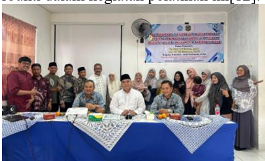
Gambar 2. Foto Bersama Peserta

Secara keseluruhan, kegiatan penyuluhan ini mendukung temuan dari berbagai penelitian sebelumnya. Misalnya, penelitian Febrian, W. D menyatakan bahwa Chat GPT secara efektifitas telah memperkaya proses penulisan dan meningkatkan kualitas karya tulis, yang juga terbukti dalam kegiatan pelatihan ini [12].