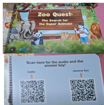
Gambar 2. Buku cerita bergambar dan bersuara

Selanjutnya, tim pelaksana memulai tahap perancangan dan pembuatan media ajar. Berdasarkan hasil media ajar dan target kelas yang sudah ditentukan, tim pelaksana mulai merancang media ajar sesuai permintaan dan kebutuhan guru Bahasa Inggris SD Virgo Maria 2 Bawen. Pada tahap ini, tim mulai menyusun isi dan struktur buku cerita yang kemudian didiskusikan bersama dengan dosen pembimbing. Dari hasil diskusi dan bimbingan, tim mulai membuat media ajar tersebut. Tim pelaksana memilih topik/judul “ In the Zoo ” karena menyesuaikan materi di buku cetak untuk kelas 5 yang digunakan, yaitu perbandingan mengenai hewan. Selain itu, siswa kelas 5 juga sudah familiar dengan kebun binatang, sehingga memudahkan mereka untuk menangkap materi yang dipelajari. Untuk hewannya sendiri, tim pelaksana memilih hewan-hewan yang sudah dikenal siswa seperti jerapah, ulat, singa, harimau, dll. Pada tahap ini, buku cerita dilengkapi dengan ilustrasi berwarna yang menarik dan sesuai isi cerita yang dibuat menggunakan aplikasi Canva . Buku tersebut juga dipasangkan dengan audio narasi oleh penutur asli yang dibuat menggunakan aplikasi Play AI dan CapCut yang dapat diakses melalui QR code yang tersedia di halaman akhir buku (Gambar 2).