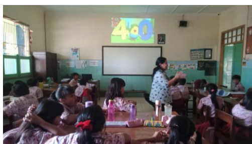
Gambar 1. Sesi observasi di kelas

Tahap kedua adalah observasi lapangan dan wawancara. Sebelum berkunjung ke sekolah, tim mahasiswa menyusun daftar periksa (untuk observasi) dan daftar pertanyaan (untuk wawancara) terlebih dahulu dengan arahan dosen pembimbing dalam sesi konsultasi. Selanjutnya, tim mahasiswa melakukan kunjungan awal ke SD Virgo Maria 2 Bawen untuk melakukan observasi kelas yang kemudian dilanjutkan dengan sesi wawancara bersama guru Bahasa Inggris. Observasi (Gambar 1) dan wawancara ini dilaksanakan pada 23 April 2025. Observasi dan wawancara ini bertujuan untuk mengetahui kesulitan guru berkaitan dengan penggunaan AVA di kelas, kondisi nyata di kelas, termasuk jumlah siswa, ketersediaan fasilitas, serta metode pengajaran yang biasa digunakan.