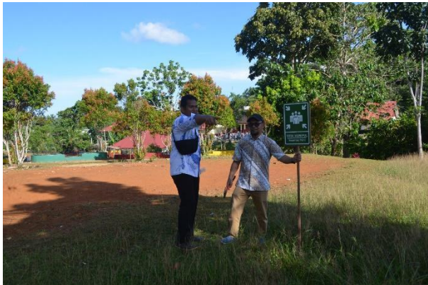
Gambar 3. Pemasangan rambu-rambu jalur evakuasi.

Berdasarkan Tabel 2 diperoleh data sebagai tolak ukur peninjau seberapa sering simulasi evakuasi gempa dan tsunami pernah dilaksanakan di sekitaran SMAN 2 Sipora, dimana hasil menunjukkan bahwa masih ada sekitar 35% siswa dan guru yang belum pernah mendapatkan simulasi ini. Hal ini cukup mengkhawatirkan, karena hanya sekitar 8 % yang merasa cukup intens dengan simulasi. Lalu pada kuioner juga disertakan dengan pertanyaan: “Apakah anda memiliki saran atau komentar terkait dengan upaya mitigasi gempa dan tsunami di daerah Anda”? Pada Tabel 2 menunjukkan kebutuhan yang cukup besar untuk adanya simulasi secara berkala dari siswa dan guru. Sikap tenang dalam menghadapi bencana dapat dicapai jika manusia sudah terbiasa dengan latihan tanggap bencana, sikap panik tentu akan mengakibatkan banyak korban.