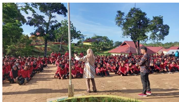
Gambar 1. Suasana Edukasi Gempa dan Tsunami.

Edukasi gempa dan tsunami melibatkan siswa dan guru SMAN 2 Sipora Kepulauan Mentawai, seperti yang ditunjukkan pada Gambar 1. Adapun kegiatan ini dihadiri oleh tim dosen Departemen Fisika Universitas Andalas, guru dan sekitar 500 siswa SMAN 2 Sipora. Pemaparan materi berkenaan dengan pengetahuan dasar tentang gempa bumi, seperti; kondisi geografis Indonesia, posisi Kepulauan Mentawai yang berada di zona Megathrust, pengertian dan pengukuran dasar gempa bumi, klasifikasi gempa bumi, kriteria gempa yang berpotensi tsunami, mitigasi bencana gempa dan tsunami, evakuasi dan pertolongan pertama saat bencana dan diakhiri dengan penjelasan teknis simulasi jika terjadi bencana.