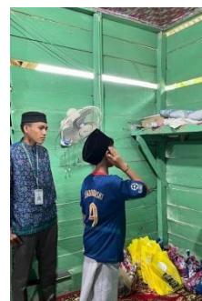
Gambar 2 : Belajar tata cara Adzan