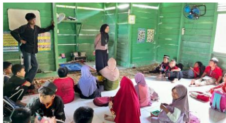
Gambar 3 : Belajar tata cara sholat wajib