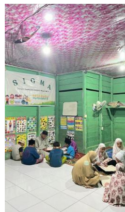
Gambar 4 : Hafalan tahfis juz 30