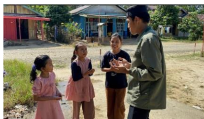
Gambar 1 : Belajar tata cara Wudhu