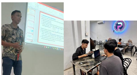
Gambar 3. Pemaparan Materi dan Penyusunan Laporan Akhir PKM

Sebelum dilakukannya penyuluhan maka dilakukan terlebih dahulu pretest sebanyak 10 soal yang telah disiapkan untuk dijawab oleh responden guna melihat