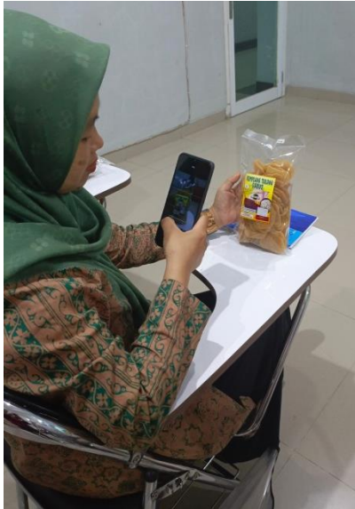
Gambar 4. Cara pengambilan foto/gambar produk untuk di unggah ke media sosial

Setelah kegiatan pelatihan, pendampingan perlu dilaksanakan secara berkelanjutan agar tenant/mitra konsisten menggunakan dan memanfaatkan teknologi dengan baik sehingga dapat membantu meningkatkan produksi yang berdaya saing secara luas.