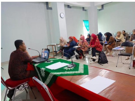
Gambar 2. Pemanfaatan teknologi

Kegiatan pengabdian kepada masyarakat “Pemanfaatan Teknologi Dalam Pemasaran Produk Pada Tenant Inkubator Bisnis Teknologi LPPM Universitas Muhammadiyah Jambi” bertujuan untuk memberikan pemahaman pemanfaatan teknologi dalam mendesain logo dan kemasan produk. Hal ini sangat penting untuk meningkatkan branding produk yang akan di pasarkan melalui internet/media social agar dapat diterima dengan baik bagi pembeli/masyarakat yang mengakses produk yang di sajikan. Luaran dari kegiatan ini tenant/mitra memiliki kemampuan branding produk dengan baik.