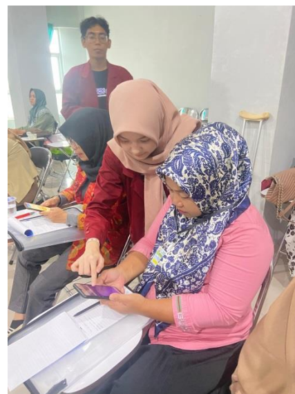
Gambar 3. Pembuatan desain logo dan kemasan produk

Pada kegiatan ini tenant/mitra diberikan akun profesional sehingga bisa lebih banyak memanfaatkan fitur aplikasi dengan lengkap, pelatihan ini diawali dengan pengenalan teknologi yang dapat membantu pekerjaan manusia kemudian pemanfaatan dalam mendesain atau bagaimana kita bisa menciptakan branding untuk produk kita sehingga bisa dikenal dengan keunikan dan kekhasannya. Tenant juga di berikan pembekalan literasi untuk bisa memberikan filosofi logo dan informasi produk pada kemasan.