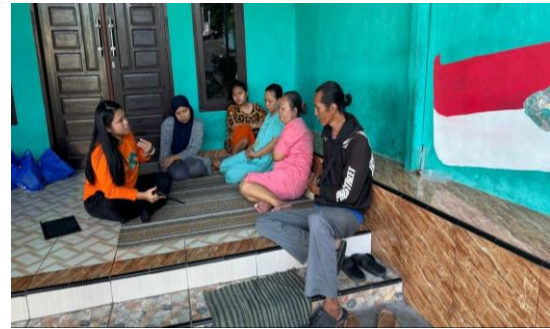
Gambar 2. Kegiatan Sosialisasi dan Brainstroming

Kegiatan Sosialisasi & Brainstorming tentang Masyarakat yang Sadar Hukum dan Upaya Hukum Guna Penyelesaian Perkara yang ada di Masyarakat dilaksanakan pada tanggal 23 February 2024 di Posyandu RT 27 Kelurahan Prapatan dari pukul 16.00 WITA sampai dengan selesai. Sosialisasi ini dilakukan kepada 5 orang warga yang di pilih secara acak, 4 wanita dan satu pria. Semua peserta sosialisasi sudah dewasa berusia diatas 18 Tahun.