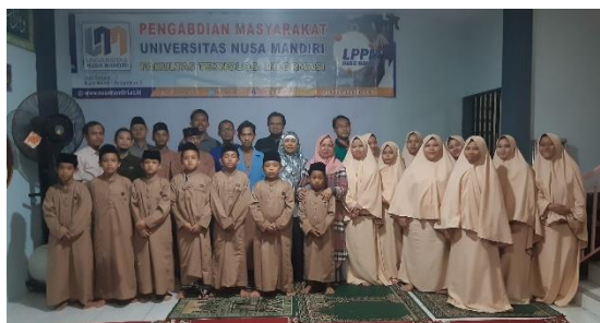
Gambar 5. Foto Bersama Antara Tutor Dan Peserta