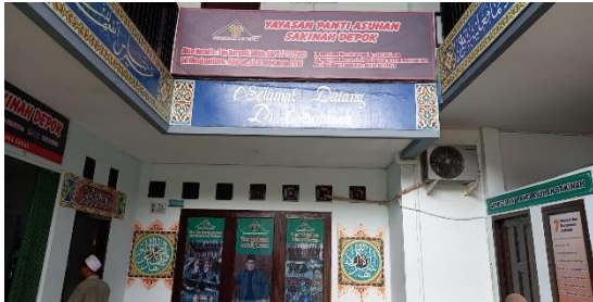
Gambar 1. Gedung Yayasan Panti Asuhan Sakinah Depok.

aspek [3]. Pengembangan nilai, pengetahuan serta perilaku masyarakat serta peserta didik menampilkan adanya hubungan antara pembelajaran dengan transformasi yang ada [6] [7].