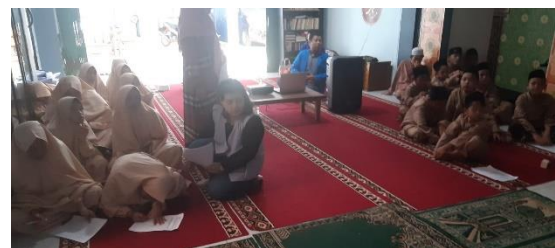
Gambar 4. Suasana Pelatihan

Selain itu, dalam pelatihan ini peserta juga diberikan pengetahuan tentang desain presentasi yang baik dan efektif, seperti penggunaan warna yang tepat, penempatan gambar, dan penggunaan font yang sesuai.