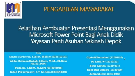
Gambar 2. Materi Pengabdian Masyarakat

Dari permasalahan yang dihadapi oleh anak didik Panti Asuhan Sakinah Depok, maka beberapa dosen Universitas Nusa Mandiri Fakultas Teknologi Informasi mengadakan pengabdian masyarakat untuk meningkatkan pengetahuan dan ketrampilan peserta didik Panti Asuhan Sakinah Depok dalam membuat presentasi menggunakan Power Point, dengan harapan dapat meningkatkan pengetahuan peserta didik tentang pembuatan media presentasi.