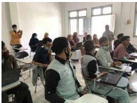
Gambar 6 Tanya Jawab dan Diskusi