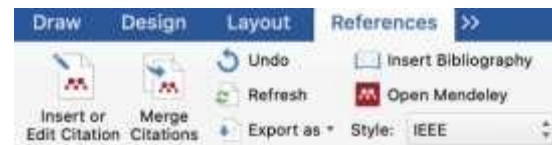
Gambar 1 Insert Citation

Mendeley sudah dapat digunakan dan sudah muncul dalam aplikasi MS Word seperti gambar dibawah ini: