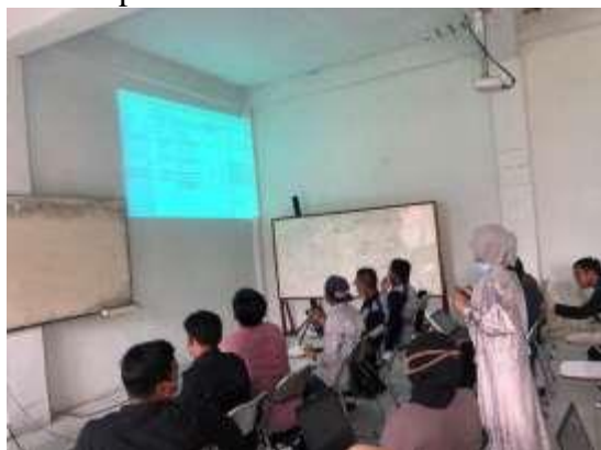
Gambar 5 Sesi Pemaparan Materi