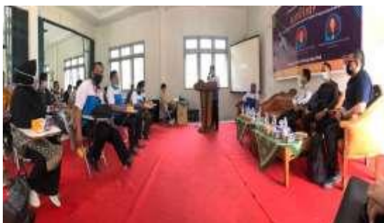
Gambar 4 Pembukaan dengan seluruh peserta