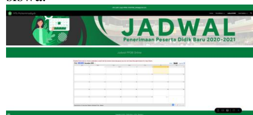
Gambar 5. Tampilan informasi jadwal pendaftaran dan daftar ulang siswa.

Setelah penjelasan materi dan praktek pembuatan website dilakukan, kegiatan dilanjutkan dengan tanya jawab dengan peserta.