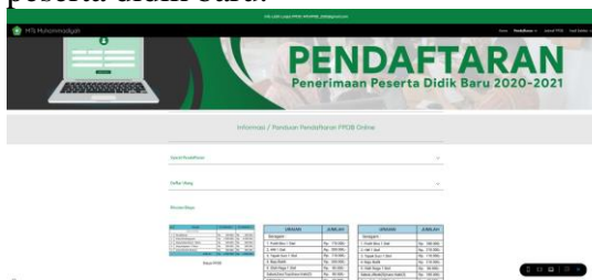
Gambar 4. Tampilan informasi biaya sekolah