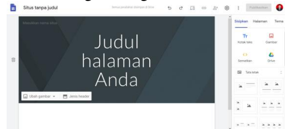
Gambar 1. Tampilan Awal Google Sites

menggunakan dan membuat sebuah website dengan Google Sites.