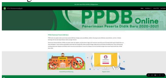
Gambar 3. Tampilan website dengan Google Sites