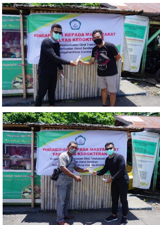
Gambar 4. Foto Pembagian Hand sanitizer dengan penduduk