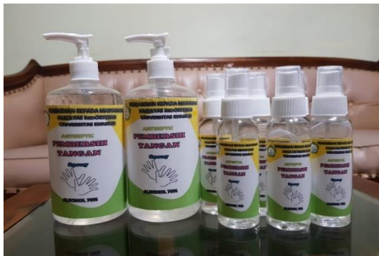
Gambar 2. Proses Pembuatan Hand sanitizer

Proses selanjutnya adalah proses pelaksanaan pengabdian di Pulau Hiri, sebelum melaksanakan pengabdian terlebih dahulu kami mengkoordinasikan jadwal yang tepat, dan tanggal 12 September 2020 menjadi waktu yang disepakati dengan pihak mitra.