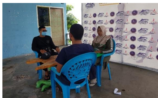
Gambar 1. Proses sosialisasi dengan Mitra

Pelaksanaan kegiatan pengabdian diawali dengan melakukan sosialisasi kepada mitra terkait kegiatan yang akan dilakukan di lokasi mitra. Sosialisasi yang dilakukan yaitu dengan menjelaskan maksud kegiatan pengabdian yaitu melakukan sosialisasi tentang manfaat obat tradisional dalam meningkatkan imun tubuh agar terhindar dari virus Covid-19 serta melaksanakan pembagian handsanitizer kepada masyarakat di Pulau Hiri