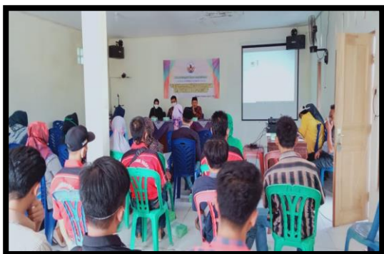
Gambar 3. Kegiatan pelatihan penyusunan laporan keuangan BUMDes.

Kegiatan pengabdian dilaksanakan bulan Maret sampai dengan bulan Oktober. Pelatihan pencatatan dan penyusunan laporan keuangan dilaksanakan di Balai Desa Balesari. Pelaksanaan kegiatan berjalan dengan baik dan lancar. Peserta pelatihan yang merupakan pengurus unit usaha dari BUMDes Balesari antusias dan fokus menyimak penjelasan dari narasumber.