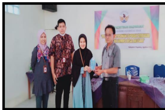
Gambar 4. Penyerahan plakat program pengabdian kepada masyarakat kepada Direktur BUMDes Desa Balesari

Kegiatan pelatihan penyusunan laporan keuangan pada BUMDes Desa Balesari telah dilaksanakan dengan baik dan lancar. Pengurus BUMDes antusias dalam mengikuti pelatihan, serta aktif untuk berdiskusi dengan pemateri. Dengan adanya pelatihan ini pengurus BUMDes memiliki pemahaman tentang dasar Akuntansi untuk melakukan penyusunan laporan keuangan yang memadai. Manfaat lain dari pelatihan ini yakni, pengurus BUMDes dapat mempertanggungjawabkan kegiatannya, salah satunya dengan melalui laporan keuangan.