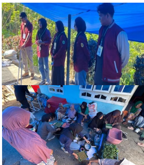
Gambar 8 Sosialisasi Hortikultura dan Hidroponik

Kegiatan sosialisasi kemudian dilaksanakan untuk memperkenalkan tujuan, mekanisme, serta manfaat program kepada masyarakat. Sosialisasi ini bertujuan untuk membangun pemahaman bersama mengenai pentingnya pemanfaatan pekarangan sebagai sumber pangan keluarga. Hasil kegiatan sosialisasi menunjukkan adanya respon yang positif dari masyarakat, yang ditunjukkan melalui tingkat partisipasi yang cukup tinggi serta antusiasme masyarakat dalam mengikuti diskusi dan sesi tanya jawab terkait budidaya hortikultura dan hidroponik. Selanjutnya, Gambar 8 menunjukkan kegiatan sosialisasi hortikultura dan hidroponik yang dilakukan kepada masyarakat, meliputi penyampaian materi, demonstrasi teknik penanaman, serta praktik langsung guna meningkatkan pemahaman dan keterampilan masyarakat dalam budidaya tanaman secara mandiri.