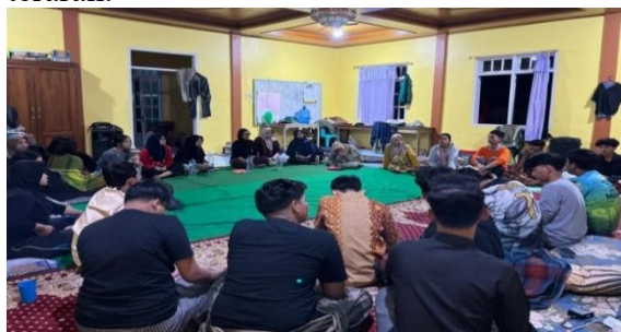
Gambar 7 Diskusi internal tim

kegiatan agar berjalan lebih efektif dan terarah.