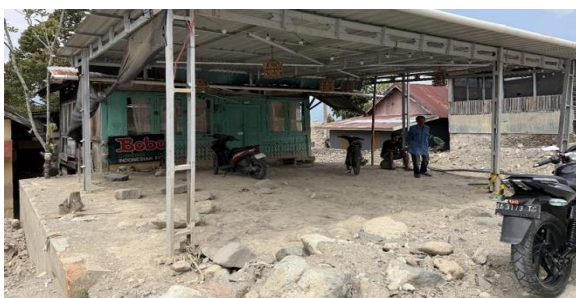
Gambar 4 Kondisi pekarangan masyarakat pascabencana

Gambar 3 merupakan tahapan yang dilakukan untuk identifikasi dan asesmen awal yang menunjukkan bahwa sebagian besar pekarangan rumah masih belum dimanfaatkan secara optimal, meskipun memiliki potensi untuk dikembangkan. Terlebih lagi pascabencana ini, kondisi pekarangan masyarakat pada gambar 4 memerlukan penataan yang lebih baik, serta memberikan kebermanfaatan bagi setiap masyarakat, khususnya dalam aspek ketahanan pangan. Selain itu, masyarakat juga menunjukkan kebutuhan akan peningkatan pengetahuan dan keterampilan terkait budidaya tanaman hortikultura dan hidroponik.