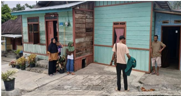
Gambar 3 Observasi lapangan

rancangan program yang telah disusun sebelumnya. Kegiatan diawali dengan proses identifikasi dan asesmen awal melalui observasi lapangan untuk memperoleh gambaran mengenai kondisi masyarakat pascabencana banjir.