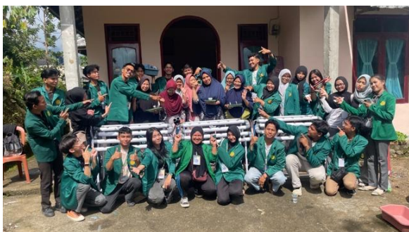
Gambar 11 Hidroponik Metode NFT

Sebagai bentuk penerapan teknologi untuk mengembangkan keterampilan masyarakat secara berkelanjutan, tim menyalurkan sebanyak 2.800 bibit tanaman hortikultura yang terdiri dari cabai, tomat, dan terong kepada masyarakat. Bibit tersebut dibudidayakan menggunakan media tanam dalam polybag yang ditempatkan di pekarangan rumah. Selain itu, tim juga menyediakan 120 unit instalasi hidroponik metode wick serta 25 unit instalasi hidroponik metode NFT ( Nutrient Film Technique ) yang dipasang pada pekarangan rumah di lingkungan masyarakat.