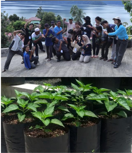
Gambar 10 Hasil pemindahan bibit hortikultura ke polybag

Sebagai bentuk penerapan teknologi untuk mengembangkan keterampilan masyarakat secara berkelanjutan, tim menyalurkan sebanyak 2.800 bibit tanaman hortikultura yang terdiri dari cabai, tomat, dan terong kepada masyarakat. Bibit tersebut dibudidayakan menggunakan media tanam dalam polybag yang ditempatkan di pekarangan rumah. Selain itu, tim juga menyediakan 120 unit instalasi hidroponik metode wick serta 25 unit instalasi hidroponik metode NFT ( Nutrient Film Technique ) yang dipasang pada pekarangan rumah di lingkungan masyarakat.