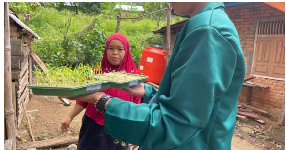
Gambar 12 Monitoring bibit hidroponik

Keberlanjutan kegiatan budidaya didukung melalui kegiatan pendampingan dan monitoring yang dilakukan secara berkala oleh tim. Dalam kegiatan ini masyarakat memperoleh bimbingan dalam mengatasi berbagai kendala teknis yang muncul selama proses budidaya, seperti pengaturan nutrisi tanaman, pemeliharaan instalasi hidroponik, serta pengendalian hama dan penyakit tanaman. Pendampingan ini juga menjadi sarana komunikasi antara tim Mahasiswa Berdampak Paduan Suara “Svara Gita” dan masyarakat dalam melakukan evaluasi terhadap perkembangan kegiatan budidaya di lapangan. Pada gambar 12 menunjukkan hasil perkembangan benih sayuran hidropinik.