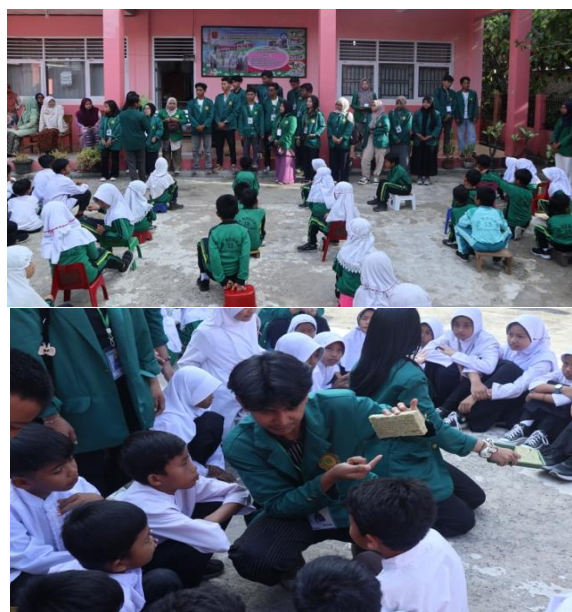
Gambar 9 Sosialisasi di SDN 13 Tanjung Sani

mitra utama, kegiatan sosialisasi juga diperluas kepada masyarakat sekitar, anggota organisasi Muhammadiyah setempat, serta siswa SD Negeri 13 Tanjung Sani. Kegiatan ini bertujuan untuk meningkatkan kesadaran masyarakat secara lebih luas mengenai pentingnya pemanfaatan sumber daya lokal dalam mendukung ketahanan pangan keluarga.