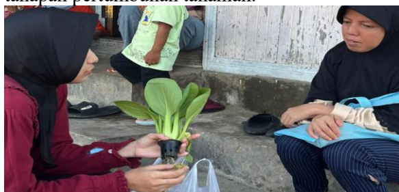
Gambar 14 Sayuran hasil hidroponik

keterbatasan waktu pelaksanaan kegiatan pengabdian, khususnya pada tanaman hidroponik, juga diberikan contoh (sampel) tanaman dengan variasi umur, mulai dari fase awal (bibit) hingga fase siap panen, guna memberikan gambaran menyeluruh mengenai tahapan pertumbuhan tanaman.