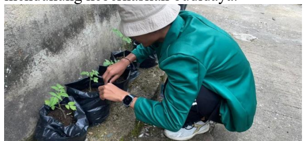
Gambar 13 Pertumbuhan bibit hortikultura

Selanjutnya, pada gambar 13 dilakukan monitoring pertumbuhan sayuran bibit hortikultura secara berkala untuk mengamati perkembangan tinggi tanaman, jumlah daun, serta kondisi kesehatan tanaman guna memastikan pertumbuhan yang optimal dan mendukung keberhasilan budidaya.