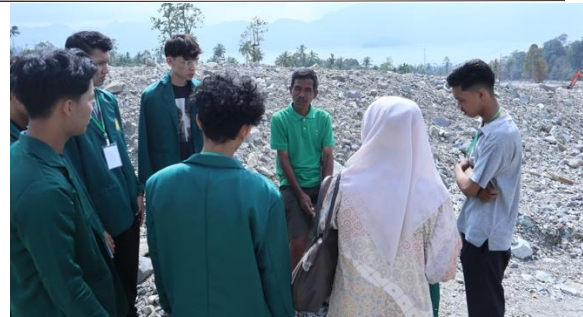
Gambar 5 Identifikasi kebutuhan masyarakat

https://doi.org/10.37859/jpumri.v10i1.11257