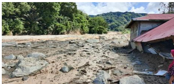
Gambar 1 Kondisi Kabupaten Agam Pasca Banjir Galodo

Permasalahan utama yang dihadapi masyarakat pascabencana meliputi keterbatasan akses terhadap pangan sehat dan bergizi, rusaknya lahan pertanian produktif akibat genangan air dan sedimentasi, rendahnya pemanfaatan pekarangan rumah sebagai sumber pangan alternatif, serta minimnya pengetahuan dan keterampilan masyarakat dalam penerapan teknologi budidaya pangan yang adaptif terhadap kondisi pascabencana [1]. Kondisi tersebut menunjukkan bahwa dampak bencana tidak hanya bersifat fisik, tetapi juga memengaruhi produksi pangan dan kemandirian ekonomi rumah tangga secara signifikan.