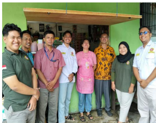
Gambar 1. Kunjungan Unit Usaha Rw

Kegiatan pelatihan kewirausahaan yang diselenggarakan di Aula Karang Taruna Kelurahan Kapuk, Cengkareng pada 13 September dan 1 Desember 2025 menghasilkan perkembangan pemahaman dan kesiapan praktis anggota Karang Taruna sebanyak 21 orang dalam aspek-aspek inti kewirausahaan. Secara umum, peserta menunjukkan peningkatan sikap entrepreneurial dan kemampuan aplikatif yang konsisten dengan tujuan program untuk menggeser pola pikir dari sekadar mencari kerja menjadi menciptakan lapangan kerja, sebagaimana ditekankan dalam materi mindset kewirausahaan [7]. Observasi selama sesi interaktif dan lokakarya menunjukkan partisipasi aktif, gagasan usaha yang relevan dengan permasalahan lokal, serta kemauan untuk mengambil risiko terukur dan tahan terhadap kegagalan kecil—indikator penting dari mentalitas pantang menyerah. Hasil ini sejalan dengan temuan bahwa pengembangan mindset wirausaha pada usia muda dapat menumbuhkan sikap kreatif, inovatif, mandiri, dan resiliensi [8].