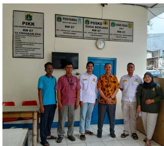
Gambar 2. Persiapan Kegiatan

pengolahan pangan berbasis lokal, layanan antar berbasis komunitas, dan ekowisata skala mikro yang memanfaatkan potensi lingkungan kelurahan Kapuk. Analisis masalah-ke-peluang yang dilakukan peserta merefleksikan strategi pemanfaatan sumber daya alam dan keahlian khas anggota [9]. Presentasi model bisnis sederhana berbasis Business Model Canvas memperlihatkan pemahaman dasar yang baik terkait penentuan segmen pelanggan, proposisi nilai, saluran distribusi, dan struktur pendapatan; beberapa kelompok bahkan memformulasikan keunikan produk yang dapat bersaing di pasar lokal maupun marketplace, yang mendukung gagasan bahwa pengembangan kewirausahaan dapat menciptakan produk atau layanan baru dan memperluas pasar [10].