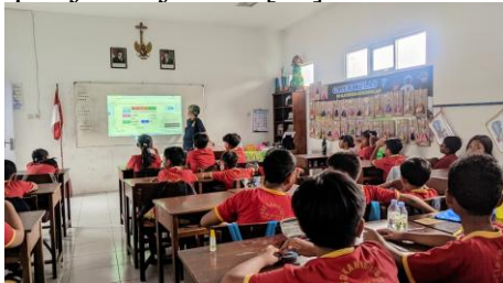
Gambar 1. Observasi awal di kelas V

kondisi kelas, karakteristik siswa, serta metode dan media pembelajaran yang digunakan dalam pelajaran Bahasa Inggris. Observasi ini bertujuan untuk mengidentifikasi kebutuhan dan permasalahan yang dihadapi siswa dalam mempelajari adjective [12].