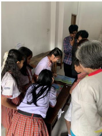
Gambar 5. Simulasi terbatas “ Adjective Adventure ” board game

saat melakukan simulasi terbatas menunjukkan bahwa penggunaan board game “ Adjective Adventure ” memberikan dampak positif terhadap proses pembelajaran. Siswa terlihat lebih antusias dan aktif dibandingkan saat menggunakan metode konvensional. Mereka menunjukkan semangat dalam melempar dadu, berpindah petak, dan menyelesaikan tantangan yang diberikan.