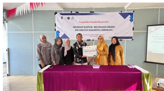
Gambar 1. Tim Pengabdian, Dosen serta Mahasiswa Jurusan Desain, dan Pihak Kelurahan Mesjid

Hasil rancangan kemudian disosialisasikan pada 9 Oktober 2025 di Aula Kantor Kelurahan Mesjid, dengan melibatkan perangkat kelurahan dan masyarakat. Forum ini menjadi sarana validasi sekaligus penyempurnaan desain sebelum finalisasi.