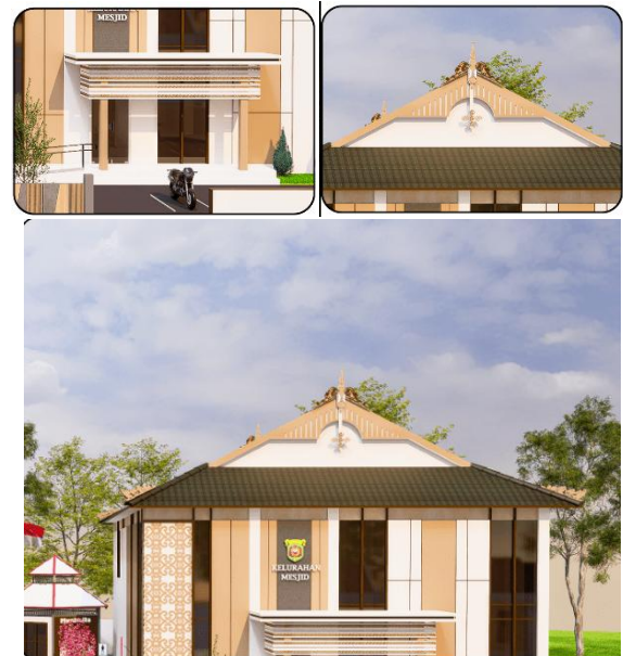
Gambar 3. Penerapan Ornamen Kutai Dayak Pada Bagian Eksterior Bangunan

Redesain Kantor Kelurahan Masjid mengusung pendekatan arsitektur neo-vernakular, yaitu strategi desain yang menafsirkan kembali prinsip-prinsip vernakular lokal agar relevan dengan kebutuhan fungsional, teknologi, dan sosial masa kini. Pendekatan ini menekankan integrasi nilai budaya, metode konstruksi lokal, dan solusi pasif iklim untuk menghasilkan bangunan yang kontekstual, berkelanjutan, dan bermakna bagi masyarakat setempat [13].