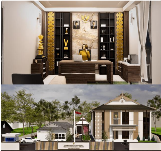
Gambar 4. Ekspresi Arsitektur Bangunan Kantor Kelurahan Mesjid

untuk efisiensi energi serta kenyamanan termal.