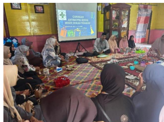
Gambar 1.2 Pelaksanaan Sosialisasi Antibiotik

Secara keseluruhan, kegiatan ini menunjukkan bahwa intervensi edukasi masyarakat dapat menjadi strategi penting dalam mendukung pencegahan stunting. Namun demikian, diperlukan keberlanjutan program melalui kolaborasi dengan tenaga kesehatan setempat agar pesan edukasi tidak berhenti pada satu kegiatan saja.