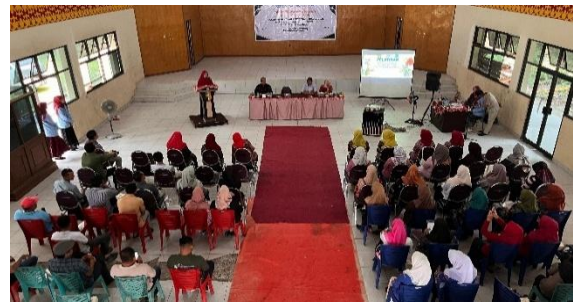
Gambar 1. Suasana pelatihan di gedung serbaguna kecamatan

Pelatihan telah dilaksanakan di Gedung Serbaguna Kecamatan Gunung Toar dan dihadiri oleh Camat serta Kepala Puskesmas Gunung Toar. Kegiatan tersebut melibatkan 26 orang kader Posyandu dari berbagai desa di Kecamatan Gunung Toar (Gambar 1). Selain itu, kegiatan juga dihadiri oleh seluruh kepala desa di wilayah kecamatan serta bidan desa yang turut berperan dalam mendampingi pelaksanaan kegiatan (Gambar 2).