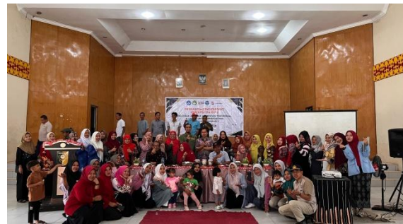
Gambar 2. Narasumber bersama dengan peserta pelatihan

Sebelum pelatihan dimulai, tim pengabdian terlebih dahulu berkoordinasi dengan pihak kecamatan dan Puskesmas Gunung Toar untuk menyampaikan sosialisasi, menjelaskan metode pelaksanaan yang akan digunakan, serta memperoleh izin resmi pelaksanaan kegiatan. Tahapan koordinasi ini menjadi langkah awal yang penting untuk memastikan keterlibatan lintas sektor dan dukungan penuh dari pemangku kepentingan di tingkat wilayah.