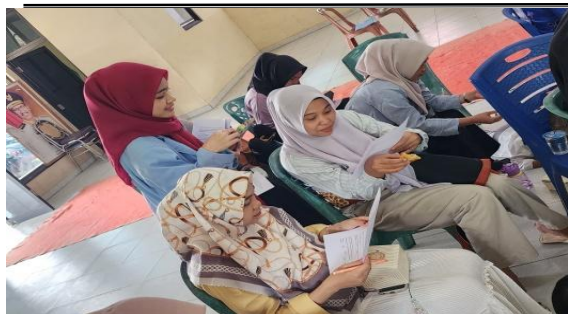
Gambar 3. Peserta mengerjakan pretest

Pelatihan terlaksana dengan sukses dan mendapatkan respons yang baik dari para kader. Sebelum pelatihan dimulai, peserta melakukan pretest dan setelah pelatihan mereka mengerjakan post-test (Gambar 3). Setiap indikator dianalisis untuk melihat perubahan sebelum dan sesudah penyuluhan. Hasil dari evaluasi pre-test dan post-test menunjukkan bahwa terjadi kenaikan skor rata-rata pengetahuan peserta dari 50 menjadi 70 (Gambar 4). Kenaikan ini menunjukkan bahwa pelatihan yang berbasis IPTEKS cukup efektif dalam memperdalam pengetahuan kader tentang pangan fermentasi tradisional. Salah satu contoh pertanyaan kuesioner yang menunjukkan peningkatan pengetahuan adalah setelah pelatihan sebagian peserta dapat menjawab pertanyaan: “Apakah Anda mengetahui apa itu makanan fermentasi khas Kuansing?” dan “Sebutkan contoh makanan fermentasi khas Kuansing yang Anda ketahui.