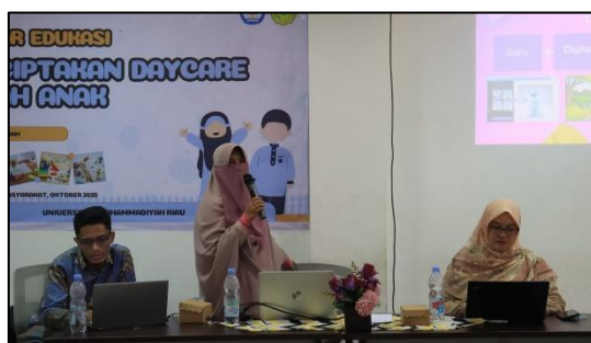
Gambar 1. Kegiatan pelatihan integrasi psikologi dan teknologi informasi di Baby Daycare Siti Walidah Pekanbaru.