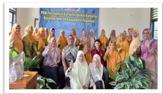
Gambar 3. Foto bersama selesai kegiatan

Rencana tindak lanjut peserta mengimplemetasikan pengetahuan pendidikan karakter dalam keluarga terhadap kekerasan anak pada cabang dan ranting wilayah masing-masing. Lebih mengaktifkan Posbakum dengan berbagai program kegiatan seperti penyuluhan hukum di komunitas, sosialisasi tentang pencegahan kekerasan seksual di komunitas dan sekolah, serta kampanye melalui media sosial.