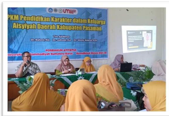
Gambar 2 Suasana pelatihan dan pendampingan

Pelatihan dan pendidikan karakter dalam keluarga dihadiri oleh semua peserta yang diundang. Peserta hadir tepat waktu sesuai jadwal yang ditentukan. Peserta yang terdiri dari ibuk-ibuk bersemangat serta terlibat dalam diskusi selama kegiatan.