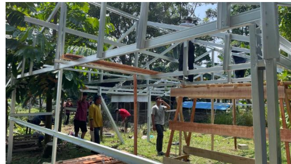
Farming di Sekolah Alam kubang raya dalam rangka uji coba inovasi teknologi.

Tim pengabdian melakukan perancangan dan penerapan sistem berbasis Internet of Things (IoT) pada Rumah Smart