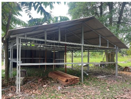
Gambar 3. Merancang sarana rumah smart farming

Pada tahap ini kedua tim pengabdian merancang teknologi sarana rumah belajar smart farming terpadu sesuai dengan pilar sekolah alam kubang raya menggunakan IT dari berbagai referensi.