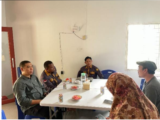
Gambar 2. Komunikasi Tim PKM Bersama mitra

Pada tahap ini kedua tim pengabdian merancang teknologi sarana rumah belajar smart farming terpadu sesuai dengan pilar sekolah alam kubang raya menggunakan IT dari berbagai referensi.