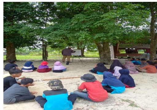
Gambar 6. Kegiatan edukasi literasi lingkungan

Setelah pembangunan Rumah Smart Farming serta perancangan teknologi berbasis IoT selesai dilaksanakan, tim pengabdian melanjutkan kegiatan dengan menanam berbagai bibit tanaman sayuran. Kegiatan ini menjadi bagian dari upaya menjadikan Rumah Smart Farming sebagai sumber belajar dan sarana peningkatan literasi pangan, khususnya dalam mendukung program MBG (Madani Berbasis Green) di Sekolah Alam Kubang Raya.