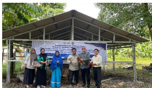
Gambar 1. Kegiatan Sosialisasi

Pada tahap awal, Tim pengabdian melakukan Kegiatan sosialisasi yang bertujuan untuk mengenalkan program PKM kepada anggota mitra Sekolah Alam Kubang Raya, keuntungan bagi mitra, tata cara pelaksanaan dan bentuk kerjasama yang ditawarkan. Sosialisasi awal merupakan langkah krusial dalam membangun pemahaman dan dukungan dari mitra terhadap program pengabdian masyarakat.