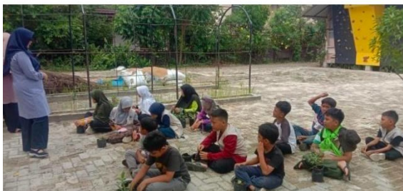
Gambar 7. Pelatihan bagi guru

Pada tahap ketiga Tim Pengabdian melakukan kegiatan pelatihan bagi guru yang merupakan merupakan langkah yang sangat tepat untuk memastikan keberhasilan implementasi teknologi IoT Rumah Smart Farming. Dengan pelatihan yang baik, guru akan lebih siap untuk membimbing siswa dalam memanfaatkan teknologi ini secara efektif.