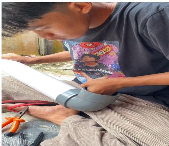
Gambar 1. Proses perakitan filtrasi air

Fasilitas yang digunakan masih kurang memadai, filter air dibuat masih menggunakan wadah yang sederhana sehingga kurangnya efektivitas dalam penggunaan filtrasi air. apalagi belum ada uji coba di laboratorium. Solusi yang dapat dilakukan dengan menjalin kemitraan bersama perguruan tinggi atau laboratorium kesehatan untuk uji kualitas air.