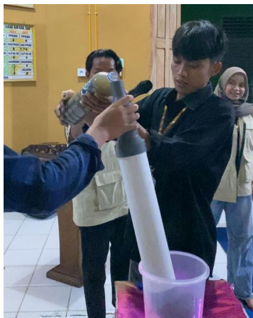
Gambar 2. Proses perakitan filtrasi air