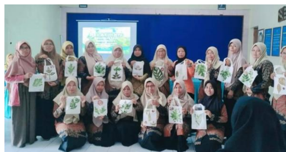
Gambar 3 gak tau aku iki gambar apa isi dewe ya.

Peningkatan drastis ini sekaligus menegaskan pentingnya strategi learning by doing , di mana peserta tidak hanya menerima informasi secara pasif, tetapi juga langsung mengaplikasikannya melalui praktik dengan pendampingan mahasiswa KKN. Dengan cara ini, peserta lebih mudah memahami alur kerja eco print dan merasa percaya diri untuk mencoba secara mandiri di luar kegiatan pelatihan. Gambar 3. Suasana saat dilakukannya kegiatan pelatihan.