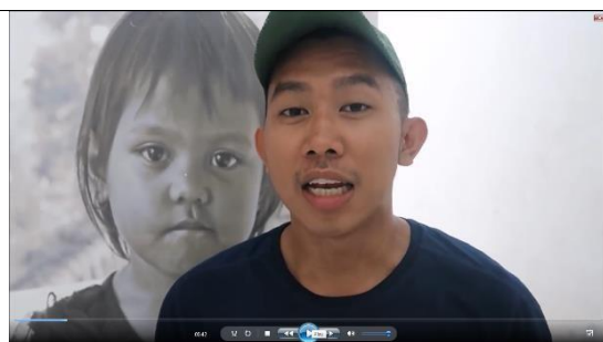
Gambar 1 Scene (00.42 – 01.02)

itu akan..kadang kala ya... kadang kala akan mengalami gejala-gejala yang berbeda”