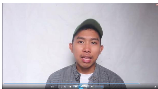
Gambar 3 Scene (07.55 – 08.51)

“Satu-satunya cara untuk mengetahui apakah itu disebabkan oleh HIV atau bukan yaitu hanya dengan melakukan tes HIV... makanya pesan gue adalah kalian jangan malu untuk pergi ke dokter atau kerumah sakit kalo kalian merasa bahwa diri kalian beresiko mengidap HIV, begitu..?!”