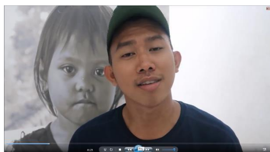
Gambar 2 Scene (01.23 – 01.44)

itu akan..kadang kala ya... kadang kala akan mengalami gejala-gejala yang berbeda”