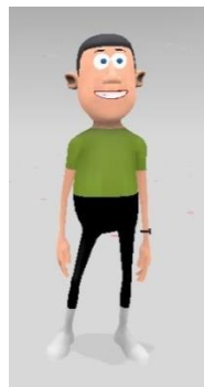
Gambar 3 Tokoh Ali

Yusuf merupakan tokoh utama di dalam film pendek animasi tiga dimensi. Yusuf adalah pribadi yang riang, bersemangat, percaya diri, penyayang, suka berderma, jahil terhadap adiknya serta suka menasehati adiknya jikalau berbuat kesalahan. Karakter Yusuf menggambarkan karakter anak-anak yang termasuk ke dalam tahap pra operasional kongkrit. Tokoh utama Yusuf dikemas dengan dua versi yang pertama untuk melantunkan Surah Al-Lail, dan yang kedua ketika berada didalam rumah.