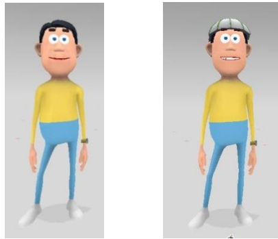
Gambar 2 Tokoh Yusuf

Yusuf merupakan tokoh utama di dalam film pendek animasi tiga dimensi. Yusuf adalah pribadi yang riang, bersemangat, percaya diri, penyayang, suka berderma, jahil terhadap adiknya serta suka menasehati adiknya jikalau berbuat kesalahan. Karakter Yusuf menggambarkan karakter anak-anak yang termasuk ke dalam tahap pra operasional kongkrit. Tokoh utama Yusuf dikemas dengan dua versi yang pertama untuk melantunkan Surah Al-Lail, dan yang kedua ketika berada didalam rumah.