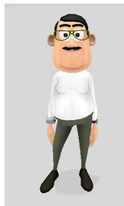
Gambar 4 Tokoh Ayah

Ali merupakan adik dari Yusuf di dalam film pendek animasi tiga dimensi. Ali adalah pribadi yang periang, bersemangat, percaya diri, cengeng dan rasa ingin tahunya yang besar. Karakter Ali menggambarkan karakteristik anak usia dini yang termasuk kedalam tahap pra operasional kongkrit. Tokoh Ali dikemas menggunakan menggunakan pakaian atasan warna hijau dan pakaian bawahan warna hitam, dimana pemilihan warna tersebut bertujuan untuk menarik perhatian peserta didik.