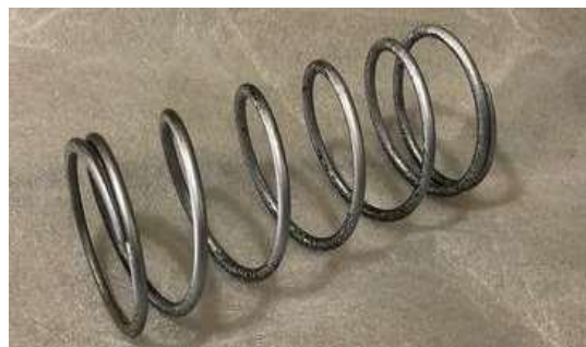
Gambar 4. Per cvt modifikasi 50mm

Selanjutnya modifikasi pada per cvt, per cvt dimodifikasi dari standart 100mm menjadi 50mm agar belting pada pulley ganda tidak naik keatas pulley ganda untuk mendapatkan torsi yang maksimal karena bagian pulley depan tidak menggunakan roller dan hanya menggunakan bushing modifikasi.