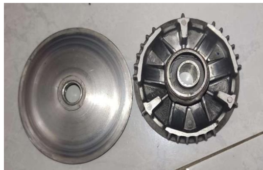
Gambar 3. Pulley depan setelah dimodifikasi

Tahapan selanjutnya yaitu modifikasi bagian bushing, bushing ini sebagai pengganti roller agar posisi belting tetap berada bagian atas pulley dan ini berdampak positif terhadap penambahan kecepatan pada motor listrik saat dibawa jalan.