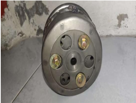
Gambar 5. kanvas ganda setelah dimodifikasi

Pada tahap akhir, modifikasi pada Pulley belakang, pulley belakang dilakukan penyambungan langsung antara drive pulley dan driven pulley dengan menggunakan baut untuk menghilangkan efek gaya sentrifugal. Modifikasi ini bertujuan meningkatkan transfer tenaga secara langsung, sehingga torsi dapat dioptimalkan.