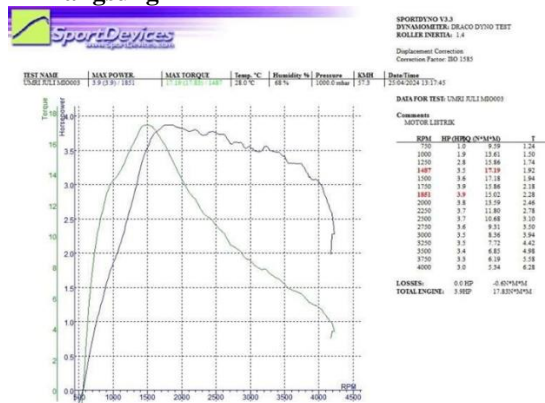
Gambar 2. Grafik hasil pengujian setelah drive pulley dilangsungkan