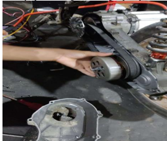
Gambar 2. Proses Pembongkaran cvt

dipilih berdasarkan analisis perbandingan torsi dan daya pada berbagai kemiringan pulley.