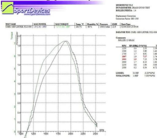
Gambar 6. hasil pengujian sepeda motor listrik mio drive pulley standart