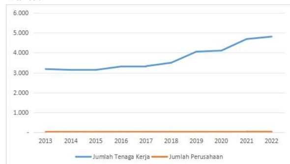
Gambar 2. Grafik Jumlah Tenaga Kerja dan Jumlah Perusahaan BUMD Provinsi Sumatra Barat Tahun 2013-2022

Data pada tabel di atas divisualisasikan ke dalam grafik berikut ini untuk memberikan gambaran bagaimana variabel-variabel tersebut berubah seiring waktu.