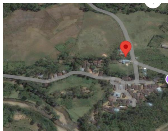
Gambar 2. Lokasi penelitian (Sumber: Google Earth, tahun 2025)

Penelitian dilakukan di Desa Senamat Ulu, Kecamatan Bathin III Ulu, Kabupaten Bungo, Provinsi Jambi. Lokasi ini dipilih karena memiliki PLTMH dengan kapasitas 30.000watt yang sudah beroperasi dan menjadi sumber listrik utama bagi sebagian masyarakat desa.