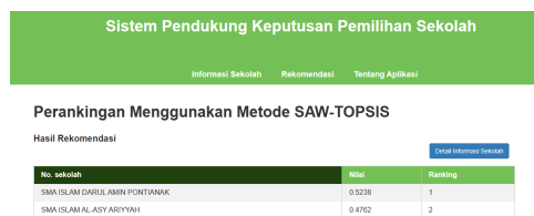
Gambar 7. Halaman Hasil Rekomendasi User

User akan dialihkan ke perankingan hasil rekomendasi dan dapat melihat informasi sekolah dengan mengklik tombol.