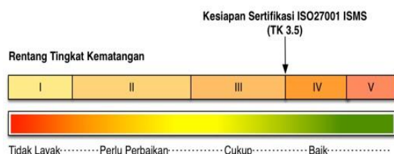
Gambar 3. Level kematangan ISO 27001

Berdasarkan tingkat kematangan diatas masih Terdapat 4 kategori yang telah ditambahkan ke level kematangan untuk penjelasan secara rinci, yaitu level I+, II+, III+ dan IV+. Standar keamanan informasi menurut standar ISO/IEC 27001:2013 dengan level kematangan keamanan informasi minimal harus berada pada level III+. Penilaian yang dilakukan dengan menggunakan indeks KAMI versi 4.2 dapat memberikan hasil berupa level kesiapan keamanan informasi seperti pada gambar berikut :