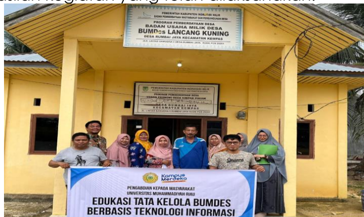
Gambar 2. Monitoring dan Evaluasi BUMDes

Selanjutnya, tim melakukan monitoring dan evaluasi dengan mengunjungi BUMDes serta melihat kembali apakah ada kendala dalam pelaksanaan penggunaan aplikasi. Evaluasi ini bertujuan untuk mengevaluasi tingkat keberhasilan kegiatan yang telah dilaksanakan.