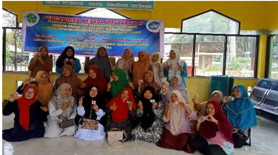
Gambar 5. Foto tim PKM bersama ibu-ibu PKK

dengan menjual produk sabun kertas. Dalam sesi ini ada beberapa ibu-ibu yang tertarik untuk membuat dan menjual produk. Untuk itu Tim PKM akan memberi pendampingan sampai pada tahap mencari pangsa pasar dan terjun langsung mendampingi penjualan sabun kertas ini.