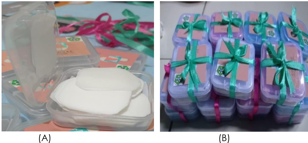
Gambar 4. (A) dan (B) Sabun kertas ekstrak kopi yang telah siap dipasarkan

Setelah selesai membuat sabun dalam bentuk cair, maka barulah sabun tersebut dapat diolah menjadi sabun kertas. Berikut alat dan bahan pembuatan sabun kertas: (1) Gunting, (2) Kertas minyak atau water soluble paper , (3) Sabun Cair, (4) Kuas, (5) Jar (Tempat menyimpan sabun). Kemudian langkah pembuatan sabun kertas disajikan dalam langkah berikut ini: (1) Ambil selembar kertas minyak atau secukupnya, oleskan sabun cair dengan menggunakan kuas secara rata, (2) Jemur atau angin anginkan kertas atau kapas sampai sabun mengering, (3) Gunting kertas sesuai selera, dapat dibentuk kotak-kotak, lingkaran atau bentuk hati, (4) Simpan kertas sabun didalam jar atau tempat penyimpanan. Sabun kertas siap digunakan. Setelah sabun kertas selesai dibuat, sabun kertas siap dikemas untuk digunakan dan dipasarkan.