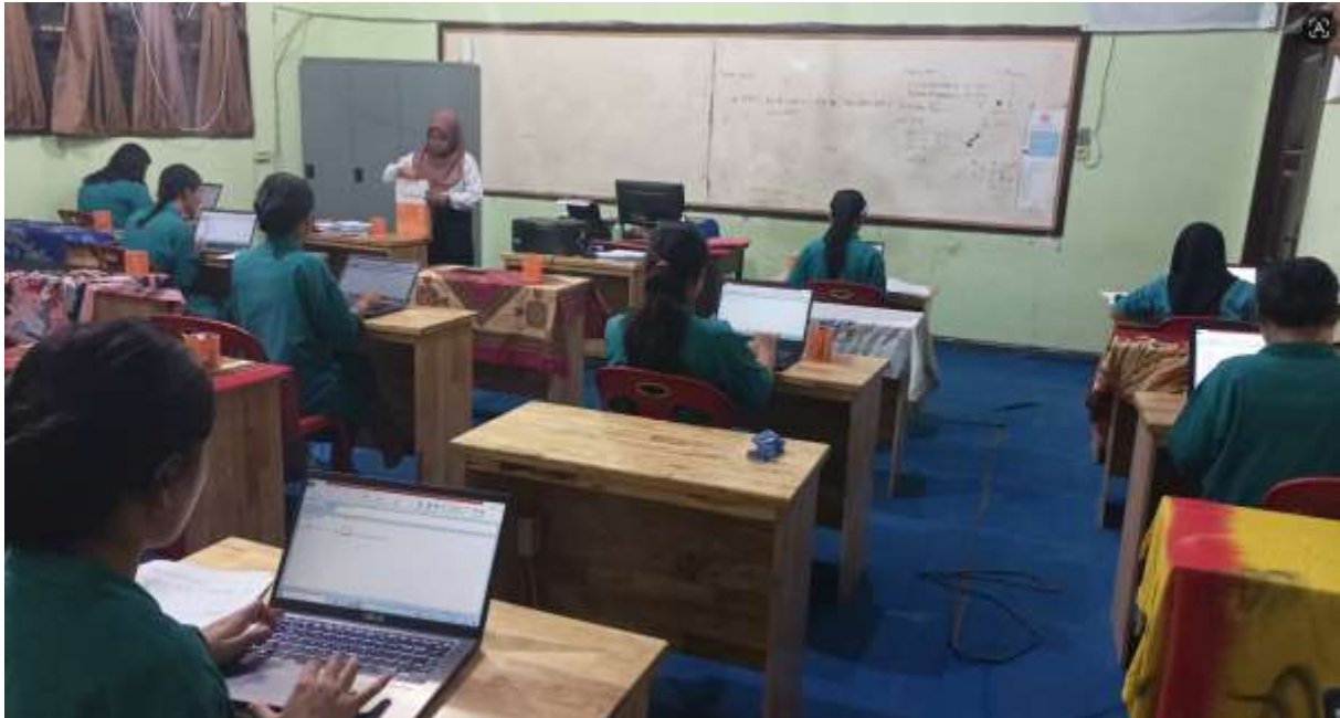
Gambar 3. Praktik penyusunan laporan keuangan berbasis komputer