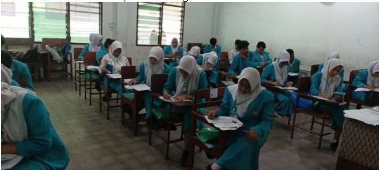
Gambar 2. Pengenalan konsep sustainable accounting dalam dunia bisnis modern.

Dengan demikian, kegiatan Pengabdian kepada Masyarakat (PkM) di SMK Marisi Medan berhasil meningkatkan kompetensi teknis dan nonteknis siswa melalui integrasi sustainable accounting dan human capital management. Program ini diharapkan dapat mendukung penguatan pendidikan vokasi yang adaptif terhadap perkembangan teknologi dan kebutuhan dunia industri pada era digital.