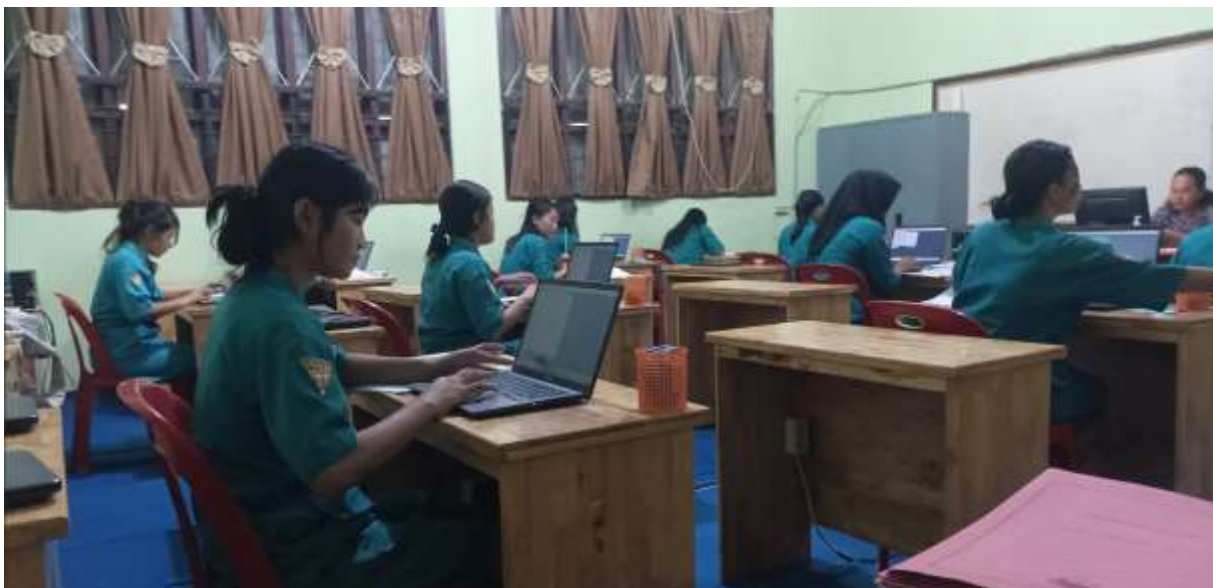
Gambar 3. Simulasi penyelesaian kasus akuntansi sebagai persiapan UKK.