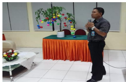
Gambar 1a dan 1b. Memberikan pelatihan membangun dan memperkuat mentalitas pebisnis UMKM di Sekolah Wirausaha Aisyiyah

Kegiatan pengabdian ini dilaksanakan pada Kamis, 13 November 2025 di Gedung Rektorat Universitas Muhammadiyah Riau Lantai 6. Peserta kegiatan berjumlah 35 orang pelaku UMKM perempuan yang telah memiliki usaha aktif dan tergabung dalam Sekolah Wirausaha Aisyiyah. Seluruh peserta berasal dari latar belakang usaha mikro dan kecil dengan